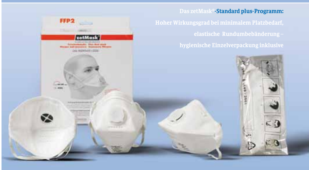
Das zetMask®-Standard plus-Programm: Hoher Wirkungsgrad bei minimalem Platzbedarf, elastische Rundumbebanderung – hygienische Einzelverpackung inklusive