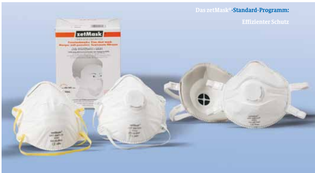
Das zetMask®-Standard-Programm: Effizienter Schutz

Soviel ist sicher: mit zetMask®-Feinstaubfiltermasken sind Sie immer optimal geschützt.