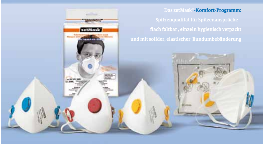
Das zetMask®-Komfort-Programm: Spitzenqualität für Spitzenansprüche – flach faltbar, einzeln hygienisch verpackt und mit solider, elastischer Rundumbebanderung